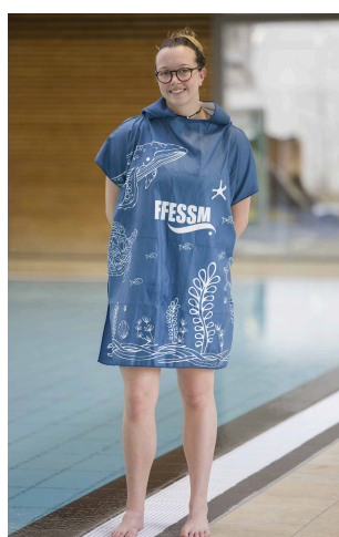
Poncho Femme FFESSM