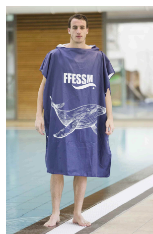
Poncho Homme FFESSM